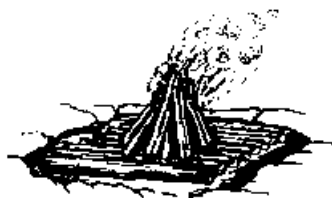
Oheň na sněhu

Tento oheň zakládáme v zimě, když je hodně sněhu. Pokud je sněhu málo, můžeme ho odhrnout a rozdělat klasický oheň. Ale pokud je sníh hluboký, nasbíráme si silnější polena a vyskládáme z nich podklad (dřevěný rošt), na kterém potom postavíme příslušný oheň.