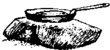
Pečení na kamnech

Je to jednoduchý přírodní gril, stačí zapíchnout do země dvě vidlice, na ně položit živý prut (zbavený kůry) s nabodnutým masem a můžeme opékat.