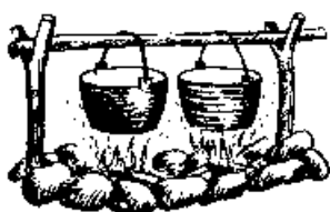
Závěs pro 2 kotlíky

Kotlík je zavěšen nad ohništěm na kovovém podstavci, který se dá koupit v železářství nebo prodejně sport. potřeb. Pokud ho nemáme, poslouží nám silnější větve.